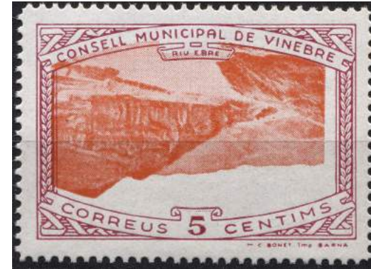
14 (Allepuz 12a) Caracteres sencillos