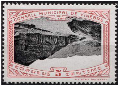
9 (Allepuz 3a) Caracteres dobles