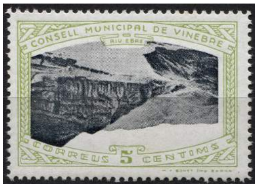
5 (Allepuz 2a) Caracteres dobles