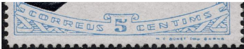
Ejemplo con caracteres dobles en la leyenda inferior