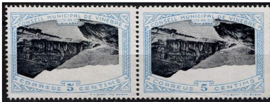
4 (Allepuz 9ba) Pareja horizontal