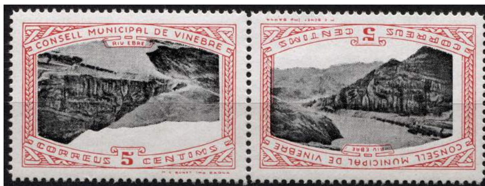
Error de centro invertido, pareja capicúa