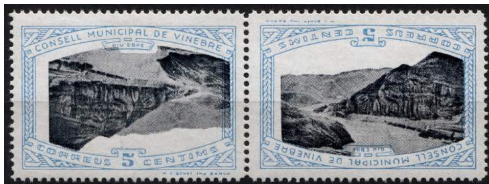
3 (Allepuz 1aii) Pareja capicúa