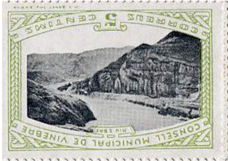
Vista del Pas de l'Ase utilizada en el diseño de los sellos

Esta emisión es también uno de los pocos ejemplos donde un sello se ilustró con una fotografía. En el sello, figura la inscripción "Riu Ebre", y la foto muestra el río a través del cañón del "Pas de l'Ase".