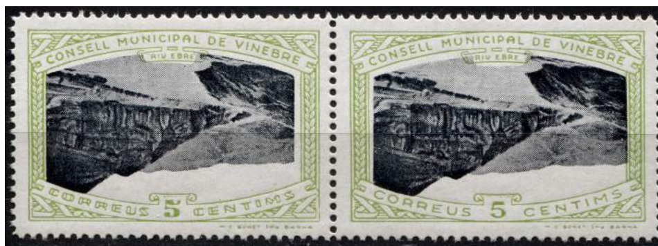
8 (Allepuz 10ba) Pareja horizontal