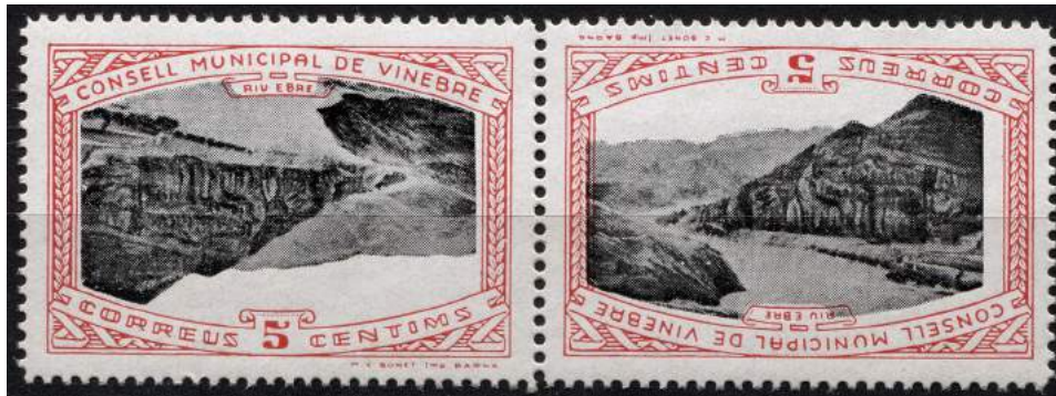
11 (Allepuz 3aii) Pareja capicúa