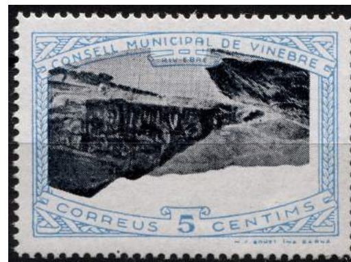
2 (Allepuz 9a) Caracteres sencillos