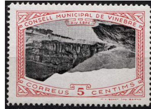
10 (Allepuz 11a) Caracteres sencillos