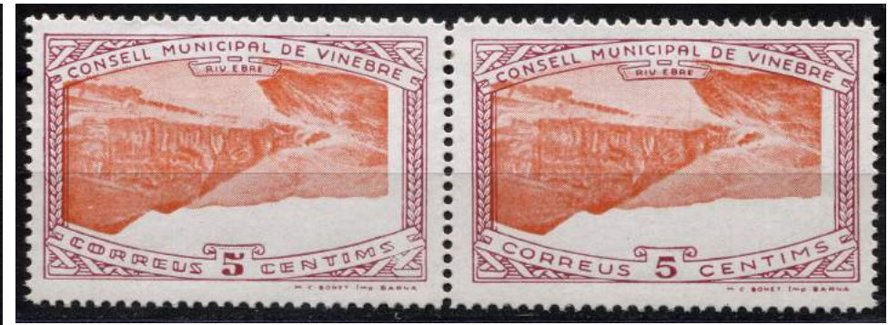
16 (Allepuz no cat) Pareja horizontal