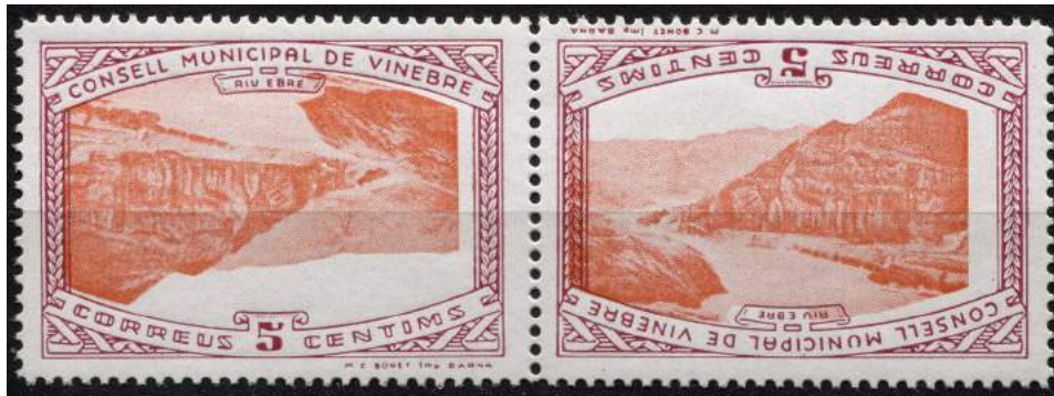
15 (Allepuz no cat) Pareja capicúa