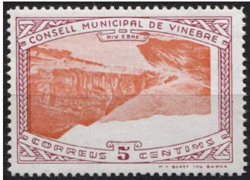
13 (Allepuz 4a) Caracteres dobles