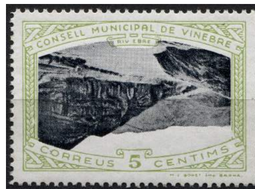
6 (Allepuz 10a) Caracteres sencillos