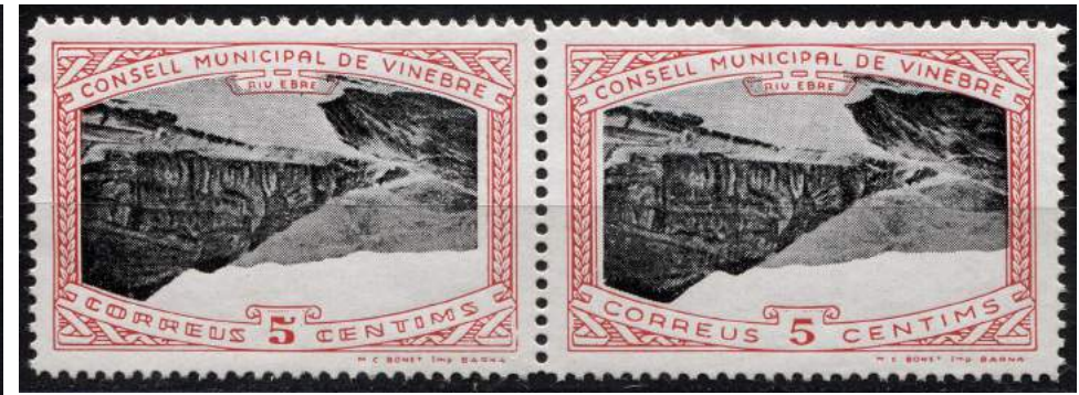
12 (Allepuz 11ba) Pareja horizontal