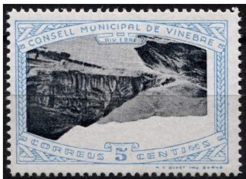
1 (Allepuz 1a) Caracteres dobles