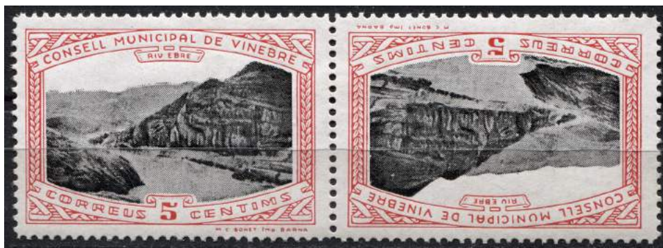
Emisión regular, pareja capicúa