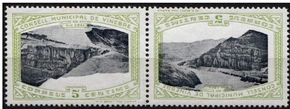
7 (Allepuz 2aii) Pareja capicúa